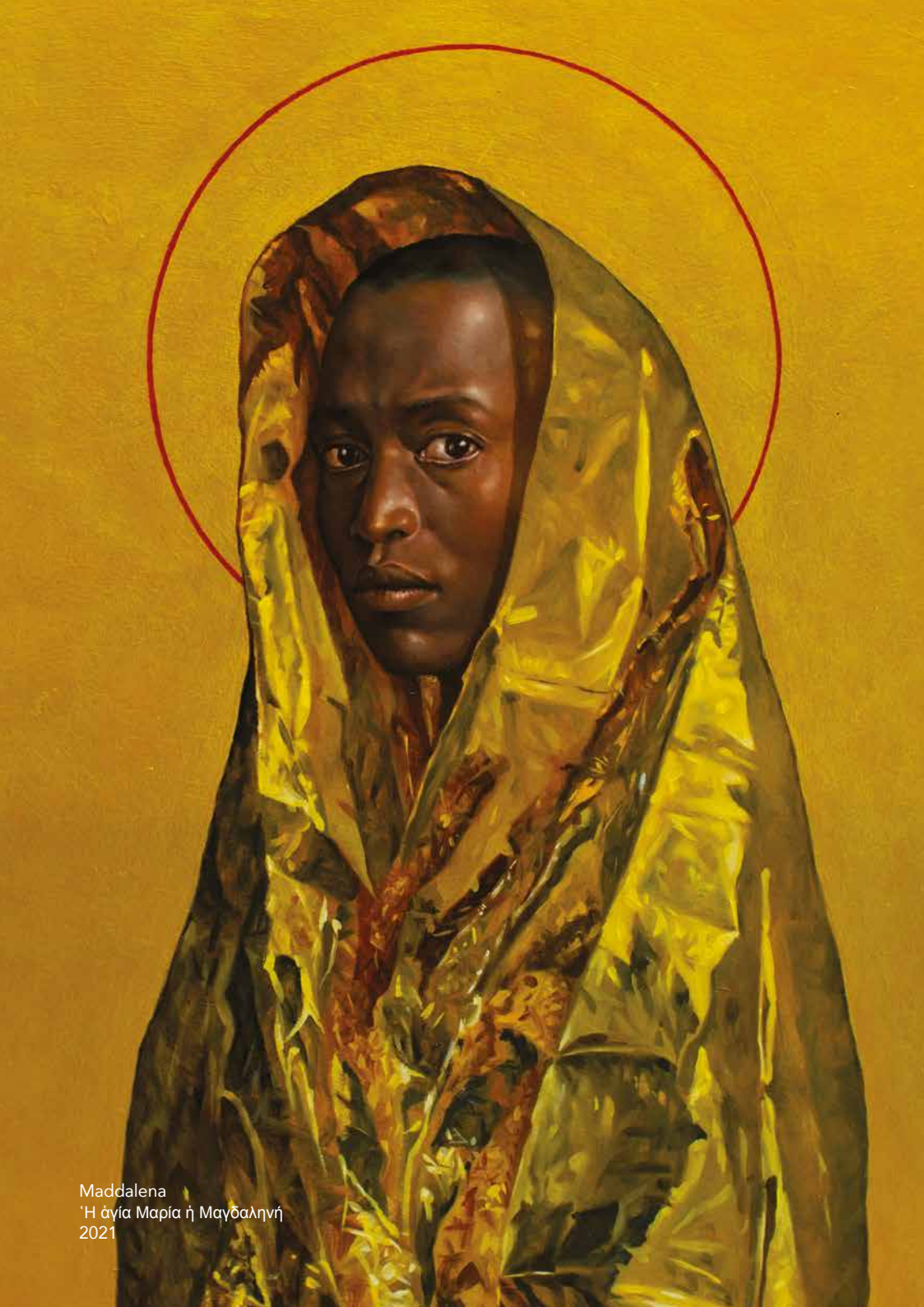
Maddalena Ἡ ἁγία Μαρία ἡ Μαγδαληνή 2021